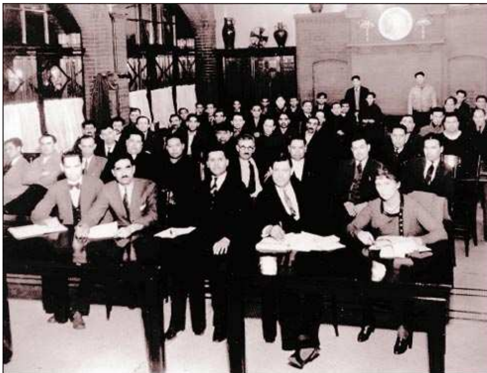
Inburgeringscursus in Hull House, omstreeks 1900.